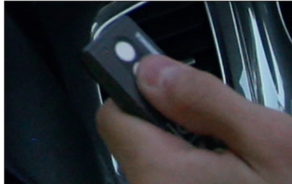
Fjernbetjening - én af flere muligheder